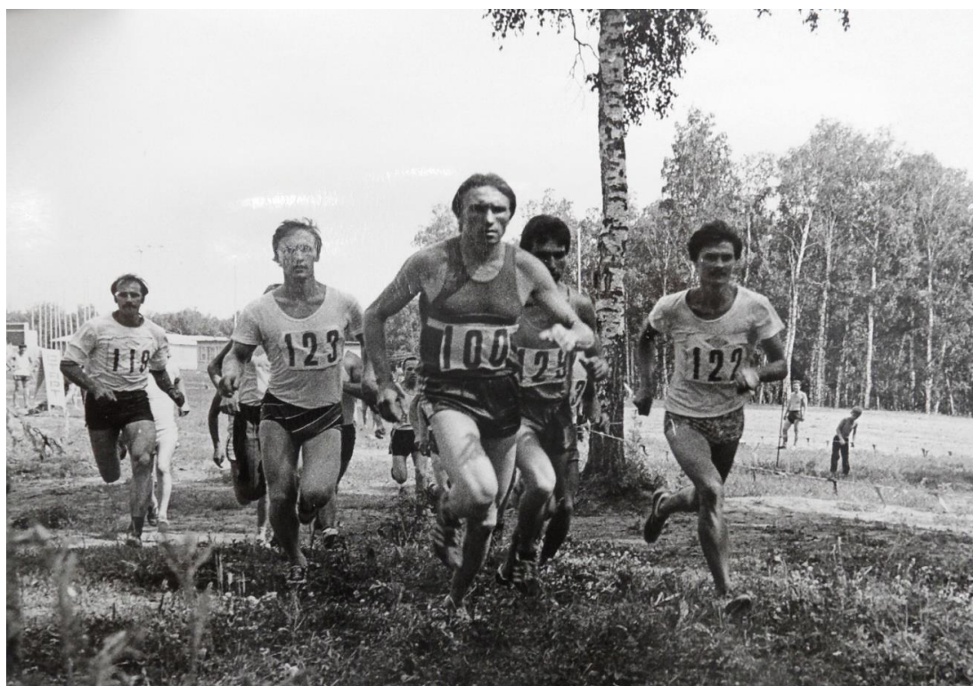
Выполнение нормативов ГТО по легкой атлетике, 1984 г.