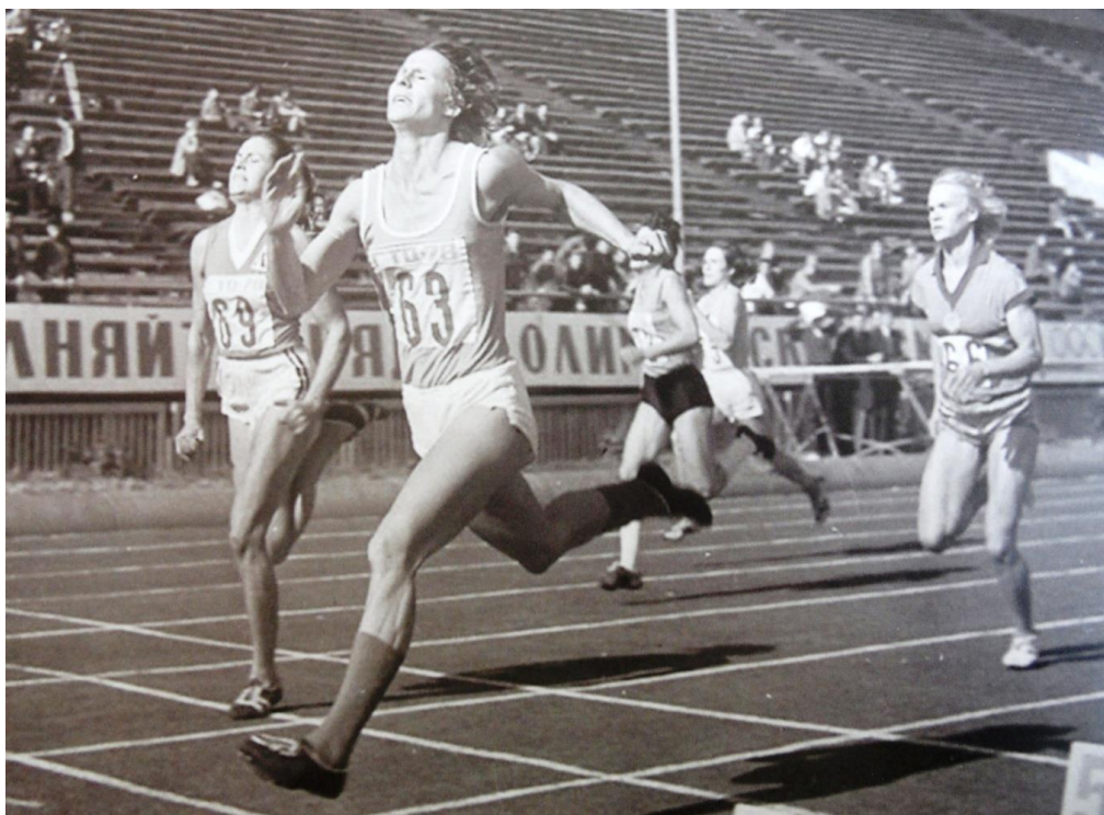
Соревнования по многоборью ГТО, 1978 г.

[История ГТО / М-во спорта Российской Федерации, Федеральное гос. бюджетное учреждение «Гос. музей спорта» ; [авт.-сост.: Е. А. Истягина–Елисеева и др.]. – Москва : Федеральное гос. бюджетное учреждение «Гос. музей спорта», 2015.с. 134]