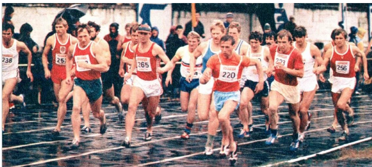
Забег на 3000 м, Чемпионат СССР по многоборью ГТО на призы газеты «Комсомольская правда», Кишинёв, 1981 г.

[История ГТО / М-во спорта Российской Федерации, Федеральное гос. бюджетное учреждение «Гос. музей спорта» ; [авт.-сост.: Е. А. Истягина–Елисеева и др.]. – Москва : Федеральное гос. бюджетное учреждение «Гос. музей спорта», 2015.с. 134]