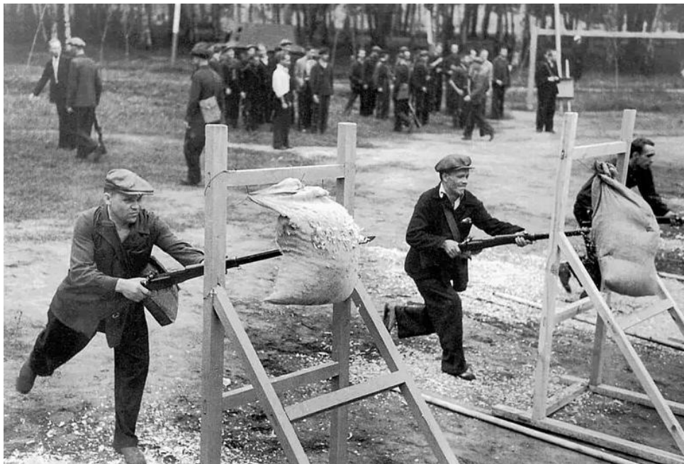
Тренировка по штыковому бою, 1941 г.

«Гос. музей спорта» ; [авт.-сост.: Е. А. Истягина–Елисеева и др.]. – Москва : Федеральное гос. бюджетное учреждение «Гос. музей спорта», 2015. с. 109]