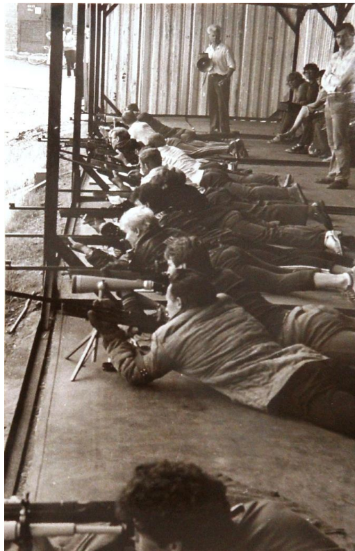
Выполнение нормативов ГТО по стрельбе, 1984 г.