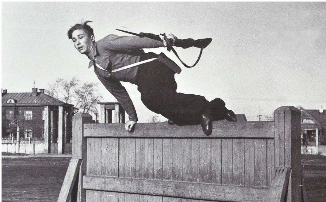
Выполнение нормативов ГТО (преодоление полосы препятствий), 1940-е гг.

[История ГТО / М-во спорта Российской Федерации, Федеральное гос. бюджетное учреждение «Гос. музей спорта» ; [авт.-сост.: Е. А. Истягина–Елисеева и др.]. – Москва : Федеральное гос. бюджетное учреждение «Гос. музей спорта», 2015. с. 104]