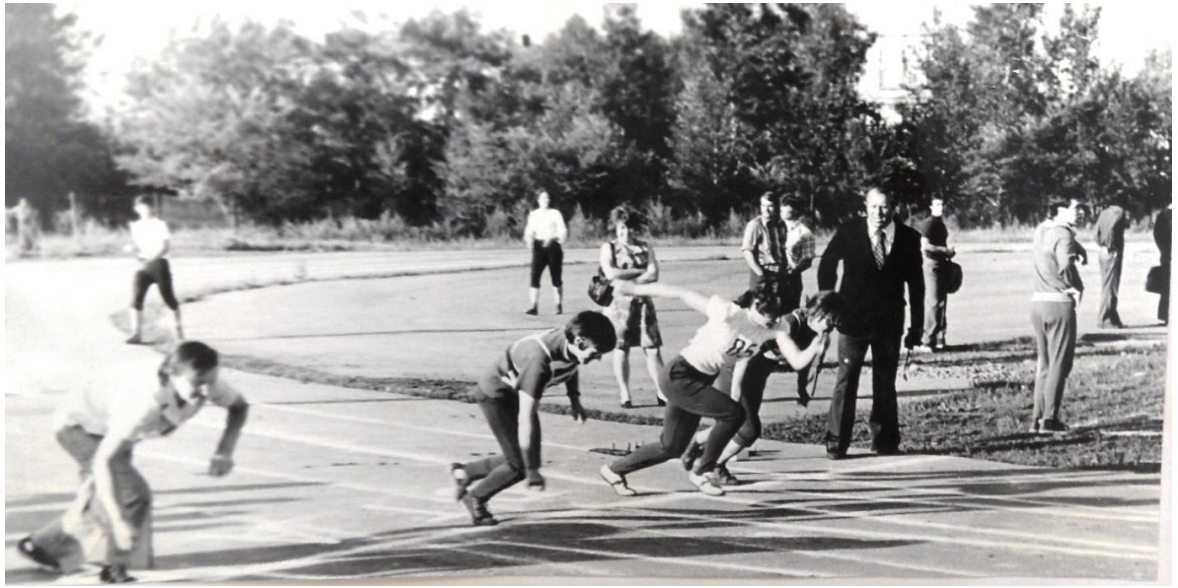
Выполнение нормативов ГТО по легкой атлетике, 1977 г.