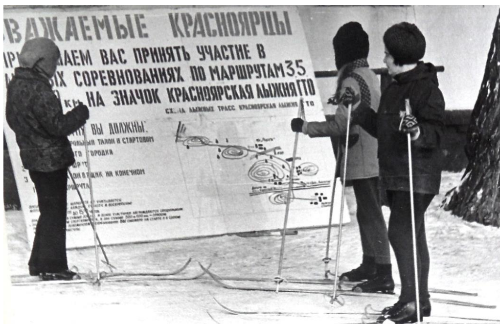
Физкультурники ДСО «Труд» на лыже ГТО, Красноярск, 1976 г.