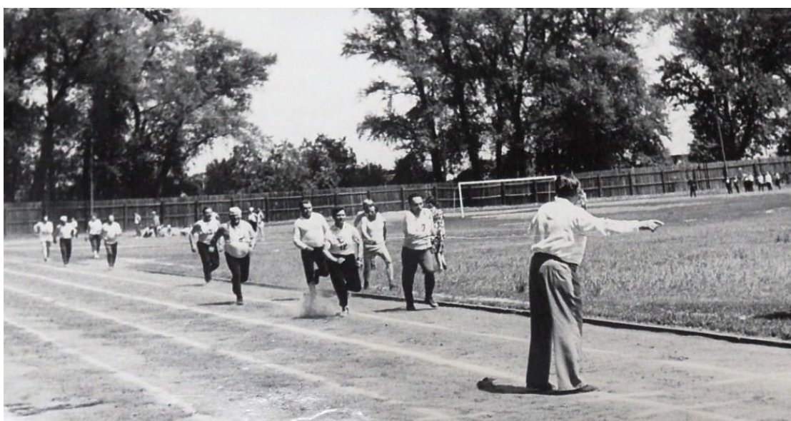
Выполнение нормативов ГТО по легкой атлетике. Вторые краевые сельские игры ГТО, 1976 г.

[История ГТО / М-во спорта Российской Федерации, Федеральное гос. бюджетное учреждение «Гос. музей спорта» ; [авт.-сост.: Е. А. Истягина–Елисеева и др.]. – Москва : Федеральное гос. бюджетное учреждение «Гос. музей спорта», 2015. с. 131]