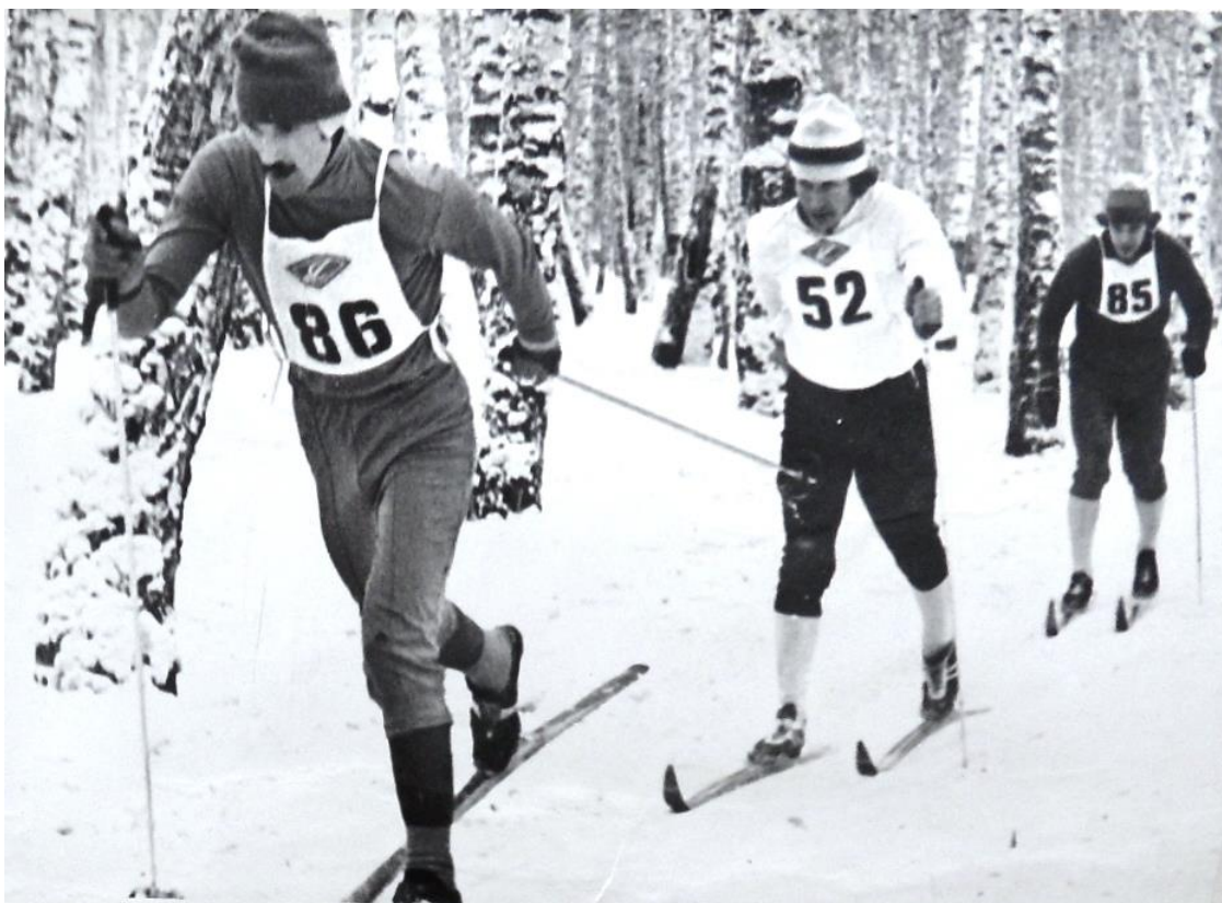
Физкультурники ДСО «Труд» на лыже ГТО, Красноярск, 1976 г.