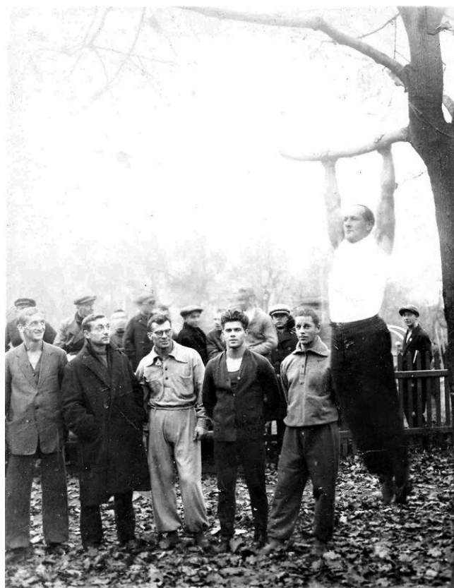
Выполнение нормативов ГТО студентами и преподавателями института физической культуры (подтягивание на перекладине), ГЦОЛИФК, г. Москва, начало 1930-х гг.

[Все начиналось так // Советский спорт. – 1966. – 4 октября. – (№ 233). – С. 5.]