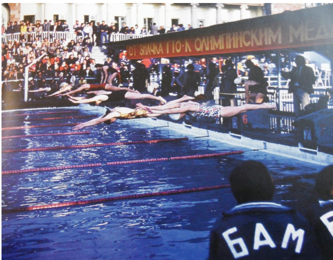
Выполнение нормативов ГТО по плаванию, 1980 г.

[История ГТО / М-во спорта Российской Федерации, Федеральное гос. бюджетное учреждение «Гос. музей спорта» ; [авт.-сост.: Е. А. Истягина–Елисеева и др.]. – Москва : Федеральное гос. бюджетное учреждение «Гос. музей спорта», 2015. с. 131]