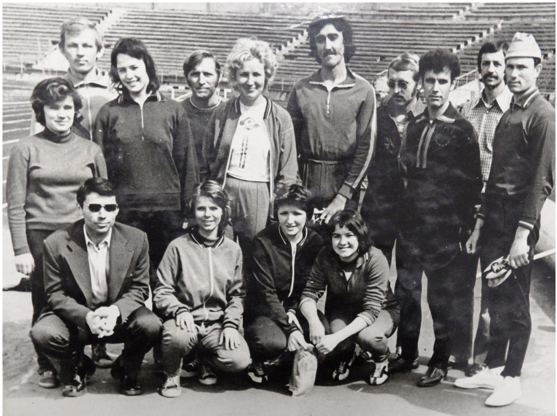
Сборная Красноярского края по многоборью ГТО, стадион имени Ленинского комсомола, Красноярск, 1976 г. [Коллекционный спортивный фонд Центр спортивной подготовки (ЦСП), Красноярск]