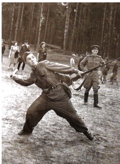
Выполнение нормативов ГТО (метание гранаты), Подмосковье, 1940-е гг. [История ГТО / М-во спорта Российской Федерации, Федеральное гос. бюджетное учреждение]