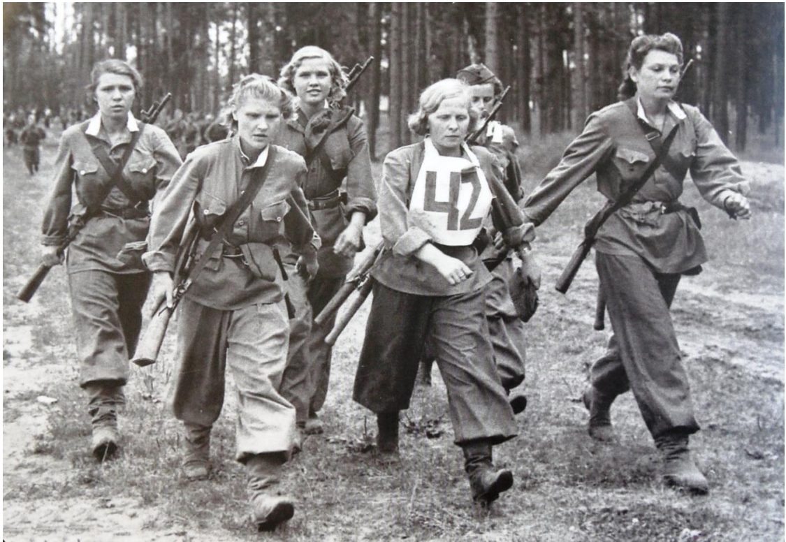
Выполнение нормативов ГТО (военизированный пеший переход), 1939 г.

[История ГТО / М-во спорта Российской Федерации, Федеральное гос. бюджетное учреждение «Гос. музей спорта» ; [авт.-сост.: Е. А. Истягина–Елисеева и др.]. – Москва : Федеральное гос. бюджетное учреждение «Гос. музей спорта», 2015. с. 104]