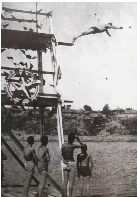
Выполнение нормативов ГТО II ступени (прыжки в воду с вышки), вторая половина 1930-х гг.