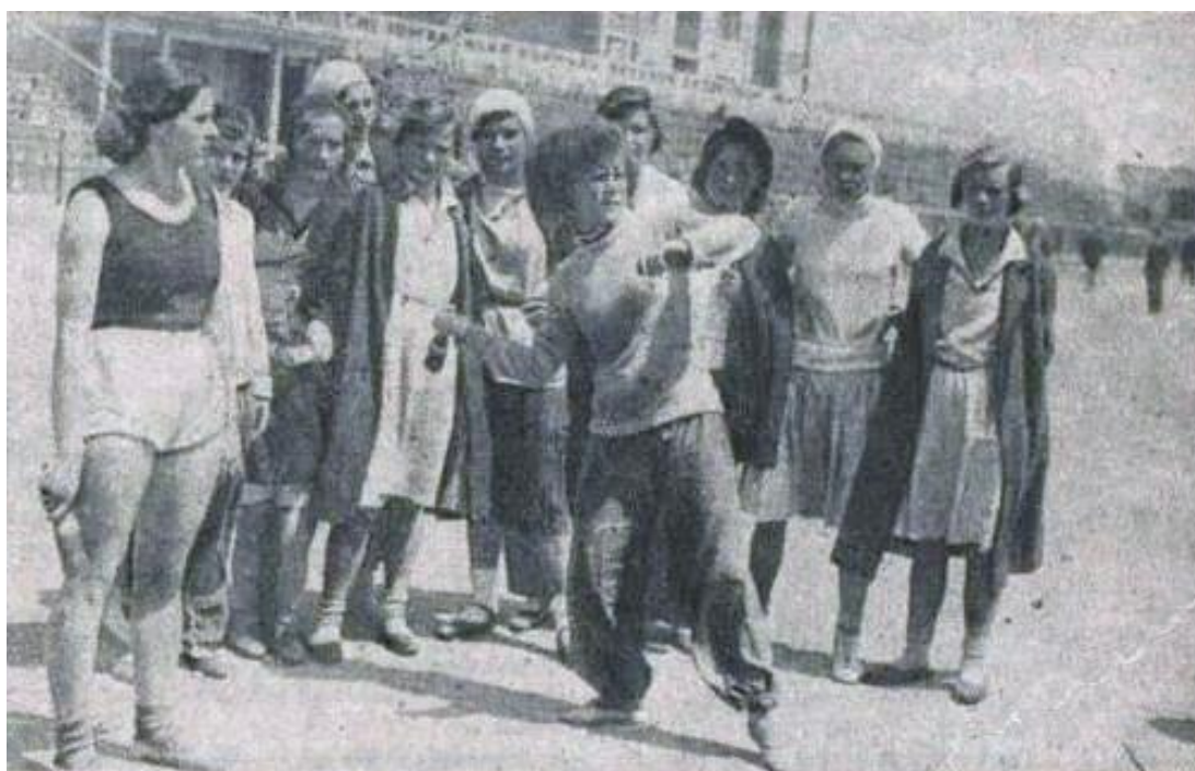
Выполнение нормативов ГТО (метание гранаты), г. Баку, 1932 г.