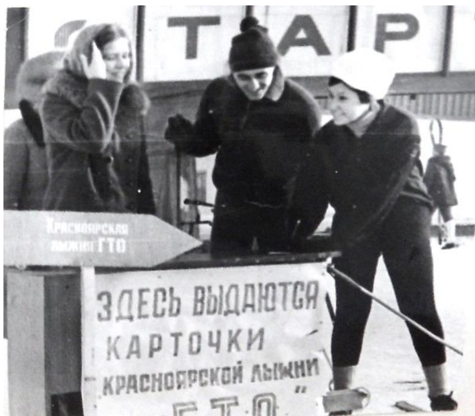
Физкультурники ДСО «Труд» на лыже ГТО, Красноярск, 1976 г.