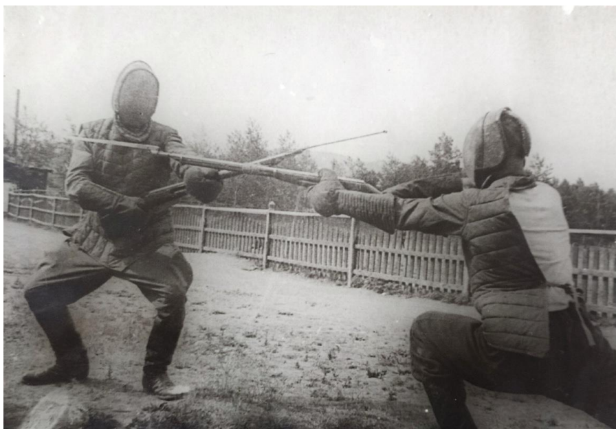
Тренировка по штыковому бою, дата съемки не известна.